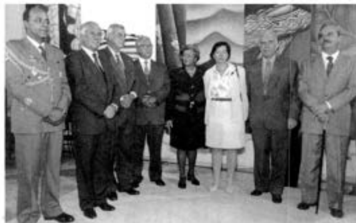
Aos novos secretários, Covas só desejou "muito trabalho"