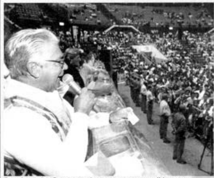
Entusiasmado, Covas sorteia apartamentos no Ibirapuera

para distribuição de apartamentos da CDHU na Capital. Foram sorteados 640 apartamentos do conjunto Vila Aurora/Jaraguá B3, na Zona Oeste. Antes já haviam sido sorteados 940 apartamentos, dos conjuntos Voith/Jaraguá A4 e Jardim Ipanema/Jaraguá F. E ainda devem ser realizados na Capital mais 18 sorteios, para distribuição de 10.034 apartamentos, para os quais há mais de 400 mil candidatos.