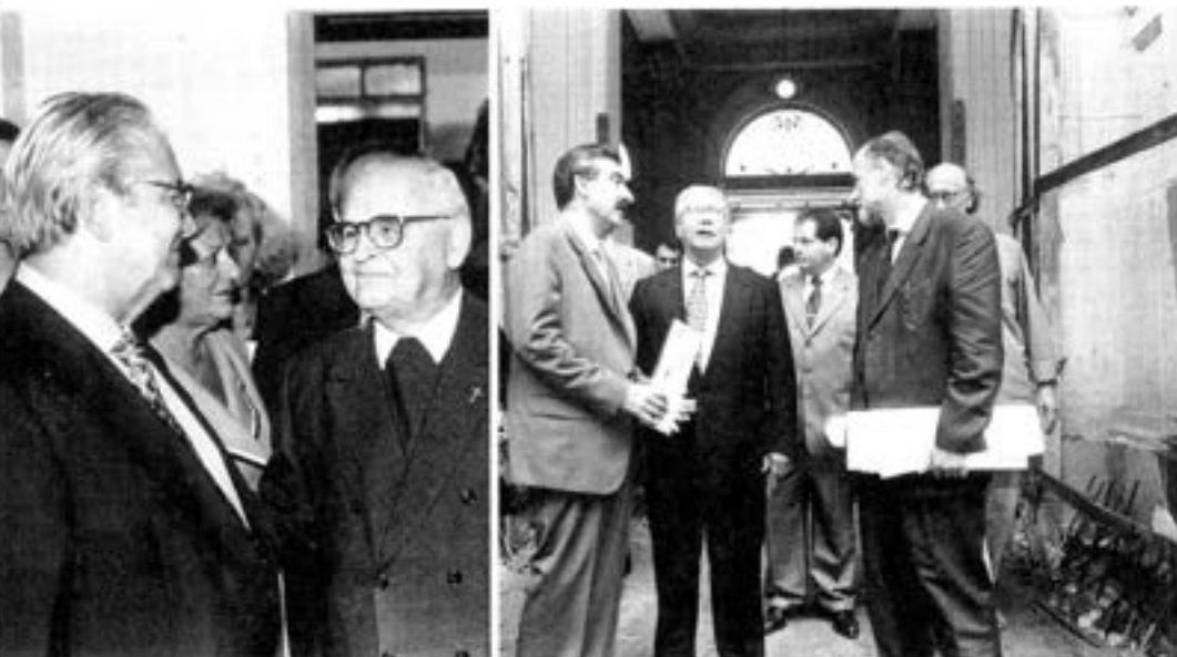
Depois de muitos anos, D. Paulo volta ao Deops, mas desta vez para uma comemoração