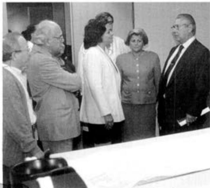
No Hospital do Servidor, Covas ouviu detalhes das reformas

Reformas vão criar 600 leitos novos no HSPE