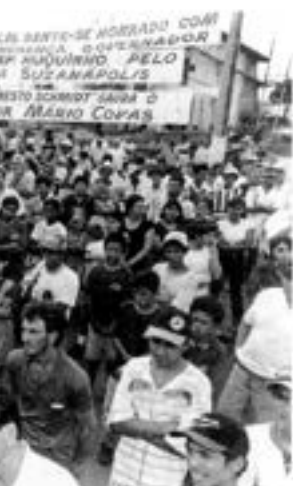
...a presença de Covas

funcionar a Escola Politécnica USP, no dia 9 de abril. O campus vai ocupar uma área de 50 mil metros quadrados no antigo Parque do Trabalhador. A construção, que será feita em módulos, vai começar ainda este ano e os primeiros cursos não serão instalados no ano seguinte. A solenidade de assinatura do convênio fez parte dos festejos dos 49 anos de emancipação administrativa de Cubatão,