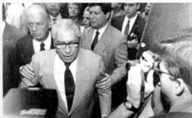
Leilão da Eletropaulo: Covas hom de briga