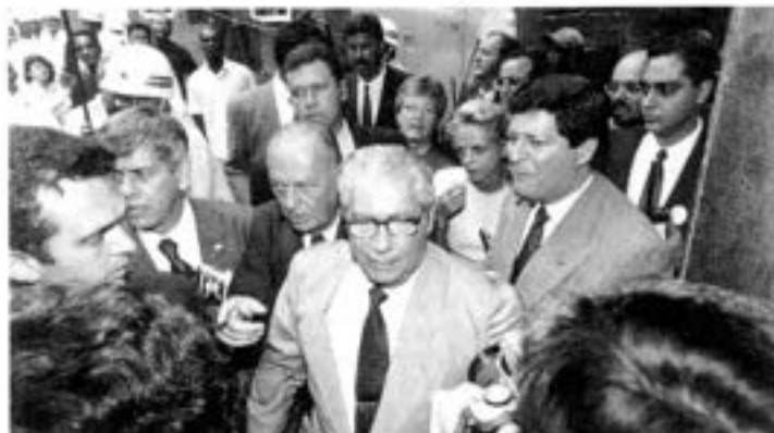
Covas deixa a Bolsa, pronto para enfrentar os provocadores

vatizada, senão o patrimônio líquido dela se consome em dez anos", afirmou o Governador. Não houve propostas para a compra da Empresa Bandeirante de Energia, que também deveria ter ido a leilão no dia 15. E o leilão da Empresa de Transmissão de Energia foi suspenso no dia 14, porque não houve depósito de caução por parte de possíveis interessados. "Na