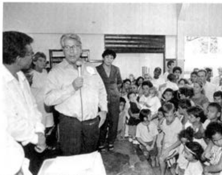
Em Nova Independência, Covas se emociona com o carinho das crianças

N a primeira quinzena de abril, o Governador Mário Covas completou o total de 607 cidades visitadas nos 40 meses de sua administração. E o Governador vai cumprir, até o fim do ano, o compromisso de visitar, pelo menos uma vez, todos os 645 municípios do Estado.